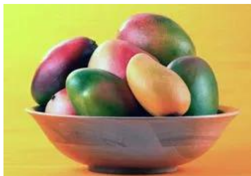
Figura 1. Fruta de mango.