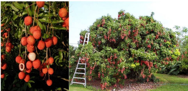
Figura 1. Lichi 'Mauritius' en cosecha y lichi 'Brewster'.