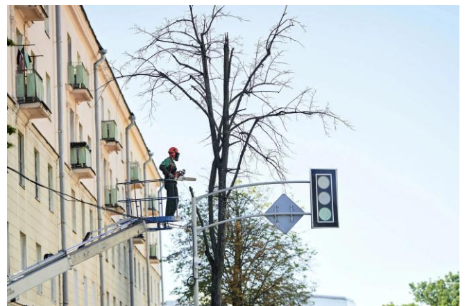
Figura 6. Los árboles de porte erguido suelen requerir menos poda para mantener las ramas despejadas del tráfico, pero por lo general necesitan una poda regular para desarrollar una estructura resistente al viento.

La forma de los árboles puede tener un impacto significativo en los requisitos de mantenimiento. Existen muchas situaciones en el paisaje urbano que exigen la presencia de árboles cerca del pavimento. Los árboles pequeños y de porte extendido, especialmente aquellos de troncos múltiples, requieren podas regulares si se plantan demasiado cerca de una acera; por el contrario, un árbol pequeño de crecimiento vertical o uno de mayor tamaño puede ser guiado para crecer por encima del paso peatonal o de la calle (Figura 6). Los árboles de forma piramidal suelen requerir menos poda para desarrollar una estructura de ramas robusta y resistente al viento que aquellos con otras formas. Los árboles con copas redondeadas, ovaladas o extendidas a menudo necesitan podas periódicas durante los primeros 25 años tras su plantación, con el fin de asegurar una buena estructura y mantener el espacio libre necesario.