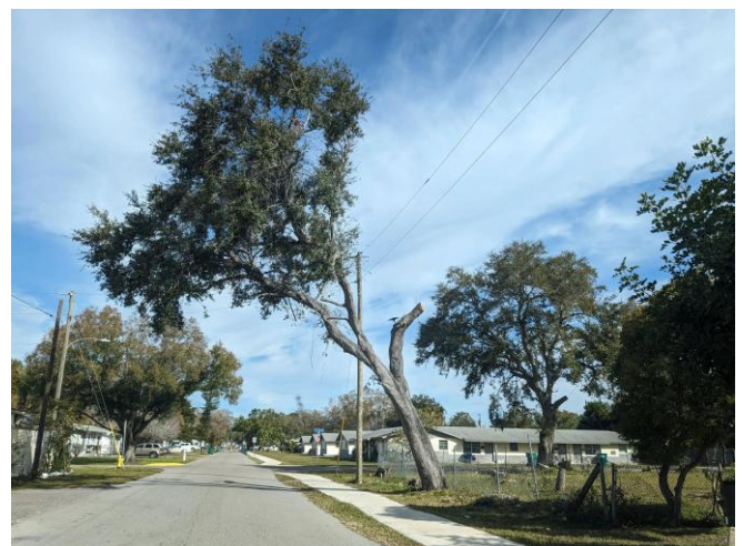
Figura 2. Los árboles ubicados bajo los cables son costosos de mantener y pueden tumbar los cables tras fuertes vientos. Algunas comunidades plantan grandes árboles bajo cables y deben podarlos para mantenerlos alejados de los cables.

Mire hacia arriba antes de plantar. A menudo, los árboles se siembran demasiado cerca de las líneas eléctricas y de las luces de seguridad. Cuando las ramas alcanzan los cables, las compañías de servicios públicos deben podarlas para garantizar un servicio seguro y confiable. Desafortunadamente, esto cuesta a las compañías de servicios públicos (y, en última instancia, a los clientes) miles de millones de dólares cada año en Estados Unidos. Reduzca los costos y minimice los daños durante huracanes plantando solo árboles del tamaño adecuado cerca de los cables (Tabla 1). Es mejor plantar los árboles lo más lejos posible de los cables (Figura 2).