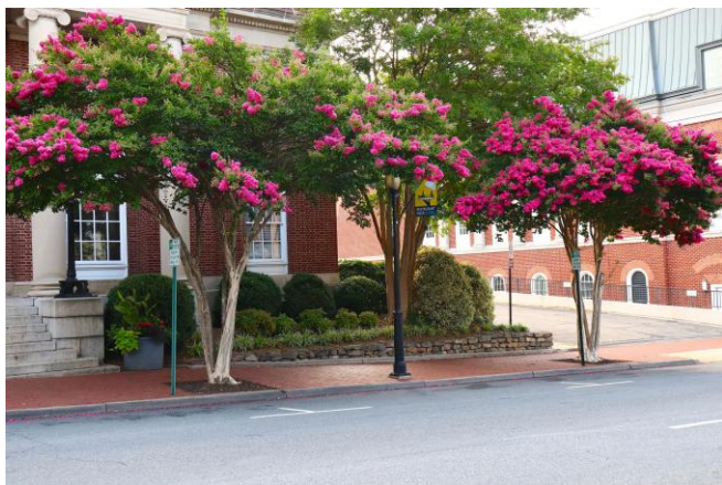
Figura 4. Los árboles que permanecen pequeños cuando se vuelven maduros deben ser plantados donde el espacio de suelo es limitado para mantenerlos saludables y estables ante los vientos, y para prevenir daño a las estructuras circundantes.