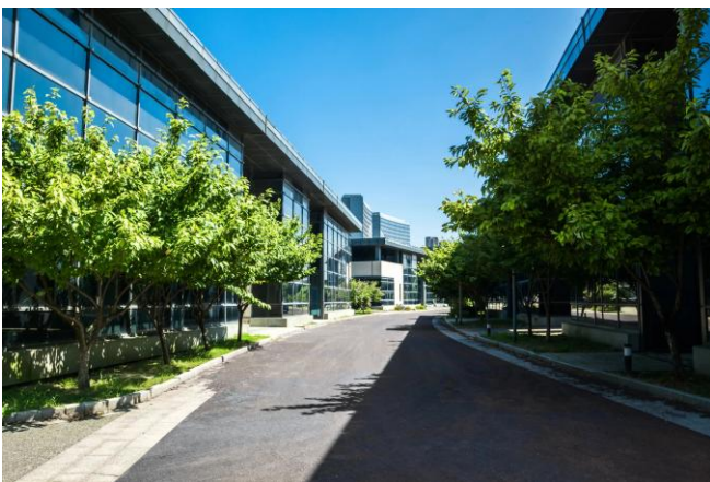
Figura 3. Plante árboles de pequeña estatura si se desea sombra cerca de los edificios. Las copas retienen el viento y los árboles pueden desprenderse cuando crecen más allá de la línea del techo.

Los árboles logran más estabilidad en el terreno cuando desarrollan un sistema de raíces uniforme con raíces rectas distribuidas uniformemente alrededor del árbol. Si un árbol está cerca de un edificio, el sistema de raíces puede volverse unilateral y desequilibrado. Los sistemas de raíces desequilibrados provocan fallas del árbol ante vientos fuertes. Un árbol con una copa estrecha puede ser una buena opción a menos de 3 metros de un edificio, aunque los doseles de los árboles pueden adaptarse creciendo más en el lado alejado del edificio. Si se desea sombra, considere plantar varios árboles de estatura pequeña para crear un dosel cerrado (Figura 3).