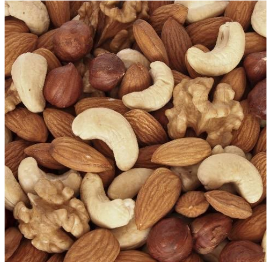
Figura 2. Las nueces tales como las almendras y las nueces de la India (anacardo) son buenas fuentes de magnesio.