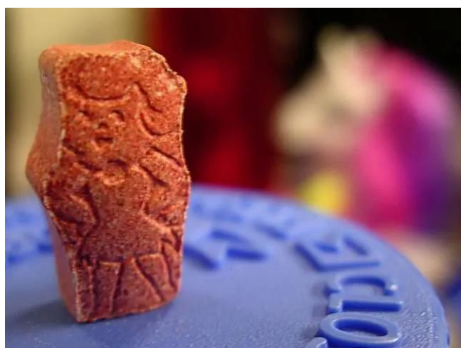
Figure 1. Vitamina masticable para niños—A muchos de nosotros se nos viene a la mente esta imagen icónica cuando pensamos en vitaminas, pero una dieta saludable realmente comienza con la elección de alimentos saludables.

Las vitaminas son compuestos químicos que el cuerpo utiliza de muchas maneras. Nosotros necesitamos obtener las vitaminas de nuestra dieta porque nuestros cuerpos no las pueden crear. Existen 13 tipos de vitaminas que han sido identificadas como nutrientes importantes para los humanos.