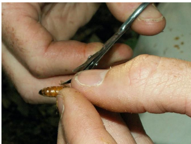
Figura 9. Utiliza una tijera pequeña para cortar la ½ del ala delantera (la mas grande) en un lado del cuerpo de la abeja.