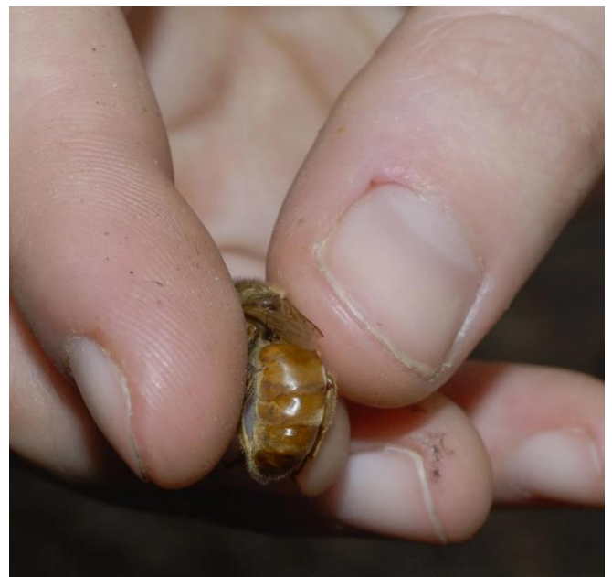
Figura 7. Una reina saludable con su ala cortada para prevenir que esta abandone la colonia con un enjambre.

ala de la reina, agarre o tome el cuerpo con el dedo pulgar y el índice como se demuestra en la Figura 8. Con unas tijeras pequeñas corte la mitad de la ala delantera (mas grande que el par trasero) de un solo lado (Figuras 8 y 9). Una reina con el ala cortada tratará de volar de la colonia con el enjambre, pero no podrá abandonar hacerlo. Como resultado, el enjambre volverá a la colmena parental. Los enjambres frustrados (aquellos que no pueden “obligar” a la reina a enjambrear porque ella está con el ala cortada), usualmente matan a la reina vieja para suplantarla por una que si pueda volar. Así que, el cortar el vuelo de la reina funciona como método para disuadir, pero no necesariamente como un método de reducir la tendencia a enjambrear. Esta práctica se usa en combinación con otros métodos que se llevan a cabo a la vez. Cabe señalar que las reinas con alas cortadas a veces salen de la colmena y no pueden volver a entrar luego de intentar enjambrear. En este caso, ella se preparará en un arbusto cercano o debajo de la colmena de donde salió y allí se juntará con un grupo de obreras a su alrededor. Estos enjambres son fáciles de capturar y de ellos se puede hacer una colonia nueva. No debe tratar de reintroducir el enjambre a la colonia parental. Una vez que las abejas deciden enjambrear, ellas continuarán tratando de hacerlo.