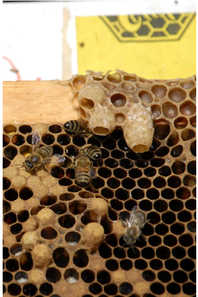
Figura 2. Esta foto demuestra dos copas de reina (no se observa larva desarrollándose) a la izquierda del centro, y una copa de reina desarrollada (conteniendo una larva) a la derecha del centro.

La colonia pasa por varios cambios en preparación al enjambre. La reina pierde una cantidad significativa de peso (las abejas obreras disminuyen la cantidad de alimento que le proveen; por lo tanto, la ponen a dieta), con el propósito de que la reina regane su habilidad de volar a un nuevo sitio para comenzar una colonia. También la cantidad de huevos que la reina produce decrece significativamente. Las abejas obreras comienzan a aglomerarse dentro de la colmena consumiendo grandes cantidades de miel. Otra actividad normal: la búsqueda de polen y néctar cesa temporariamente. Un sonido alto se empieza a escuchar entre las abejas obreras a punto de enjambrear.