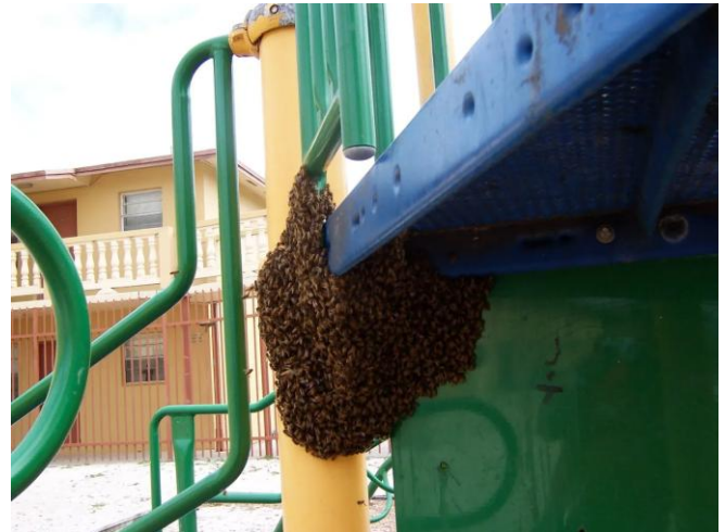
Figura 1. Un enjambre de abejas se ha formado en un área de juegos para niños.

Un manejo adecuado de colonias incluye la prevención de enjambres. Prácticas apícolas proactivas ayudan a controlar la respuesta al comportamiento de enjambre. Estas prácticas deben ser utilizadas regularmente durante la época en la cual este acontecimiento sucede con mayor frecuencia. Un buen manejo mantiene las colonias fuertes permitiendo que haya mas producción de miel y un mayor potencial de división que producirá unidades mas viables en el momento adecuado. Esto a su vez ayuda a optimizar la viabilidad del proyecto apícola.