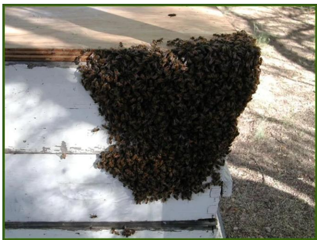
Figura 6. La usurpación de la abeja Europea por un enjambre Africano.

Se ha documentado que las abejas africanizadas (AHBs – Cuadro 1) tienen una época de producir enjambres mas duradera que la de la abeja europea. Las abejas africanizadas producen enjambres mas frecuentemente que sus contrapartes europeos y sus enjambre típicamente son mas pequeños. Los enjambres de abejas africanizadas son dóciles como los de abejas europeas. Sus características defensivas se manifiestan luego de que la colonia se establece y construye un nido, fabrica panales, y la población comienza a crecer. Sin embargo, es posible que un enjambre africanizado suplante uno europeo (esto se le conoce como usurpación), reemplazando su reina (Figura 6). El Departamento de Agricultura y Servicios al Consumidor de Florida recomienda que los apicultores introduzcan reinas nuevas en aquellas colmenas sospechosas y que se compren reinas de fuentes con buena reputación. Para más información acerca de abejas africanizadas, vea: https://edis.ifas.ufl.edu/publication/IN790 .