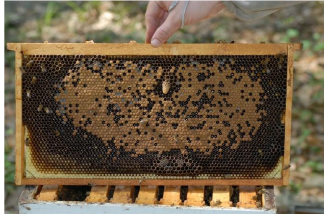
Figura 5. Una celda dentro del patrón de cría o en la parte exterior del mismo es normalmente, pero no siempre, una señal de reemplazo de la reina.

desarrollo normal. Sin embargo, cuando se trata de desarrollar una reina de una larva obrera en una etapa mas avanzada, el resultado será una reina de calidad inferior. Por esta razón las obreras tratan siempre de usar celdas de suplante en el perímetro del patrón de postura, porque es aquí donde típicamente se encuentran las larvas mas jóvenes (Figura 5). Como todo en la naturaleza, siempre hay excepciones a la regla, y puedes encontrar celdas de suplante tanto en el borde del panal como en el centro (celdas de reina dentro del patrón de postura).