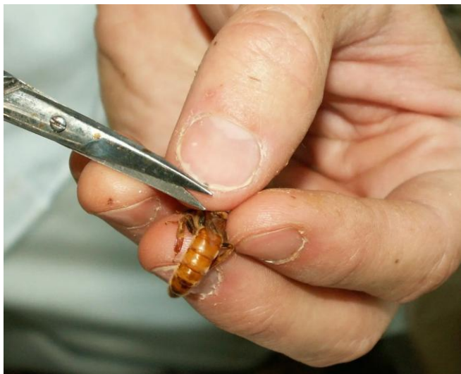
Figura 8. La posición correcta para agarrar la reina y facilitar el cortar del ala.

realiza, cada cuadro en la colonia que tenga panales con cría debe ser removido de su alza respectiva, y las abejas deben de ser removidas a su vez del panal con una a tres sacudidas rápidas. Es importante sacar del cuadro la mayor cantidad de abejas posibles, porque las mismas pueden tapar celdas de enjambre. Si una celda de reina es dejada y sellada, la colonia tendrá el estímulo para enjambrear. Solo se necesitan siete a diez días para que una celda de reina sellada se desarrolle, así que es importante realizar este proceso semanalmente.