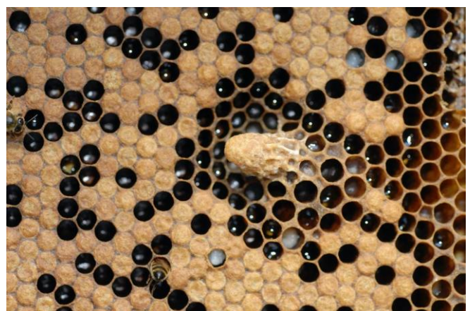
Figura 3. Una celda de reina sellada.