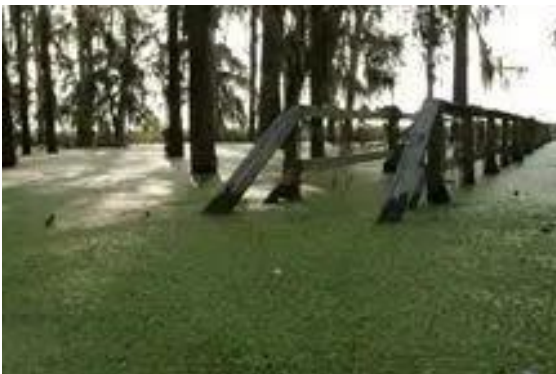
Figura 3. Un ejemplo de un hábitat ideal para que las hembras de mosquito depositen sus huevos.

Las hembras de estos mosquitos ponen los huevos en la superficie del agua, y estos eclosionan alrededor de las 24 horas. El agua es necesaria para completar el desarrollo durante el cual las larvas se convierten en pupas y luego en mosquitos adultos que rápidamente requieren sangre para alimentarse. Después de que la hembra recién emergida se aparee y encuentra una fuente de sangre, puede comenzar el ciclo de nuevo poniendo sus huevos en el agua estancada.