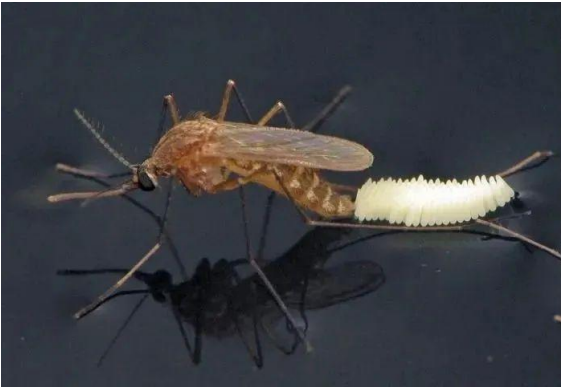
Figura 2. Mosquito de agua estancada con huevos ( Culex quinquefasciatus ).